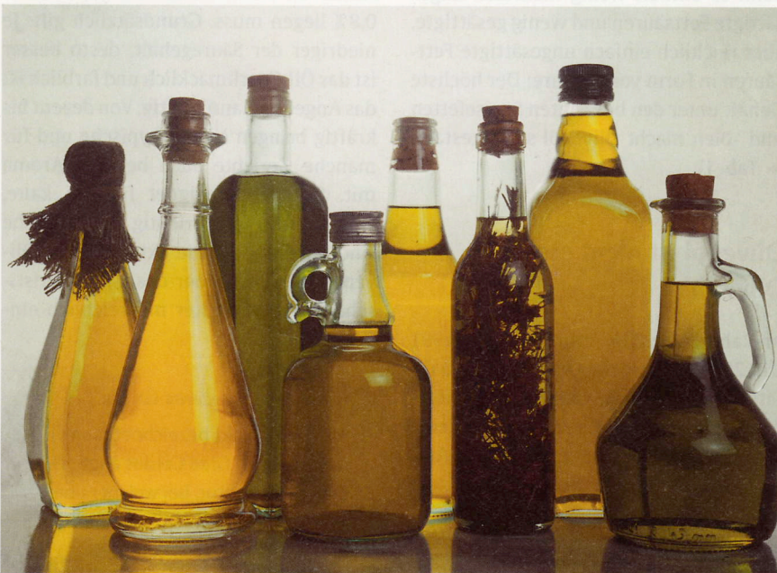
► Abb. 2 Olivenöle können erheblich in Farbe und Geschmack variieren – gesund sind sie alle.

Dies gilt ebenso für die Güteklasse „Natives Olivenöl“. Es unterliegt den gleichen Qualitätsanforderungen, bis auf den Anteil der freien Säuren: Dieser darf bis zu 2% betragen. Bei einem Säureanteil ab 2% spricht man von Lampantöl, das nicht mehr zum Verzehr geeignet ist. Somit bleiben auch diese Olivenöle stabil bis zu 180°C.