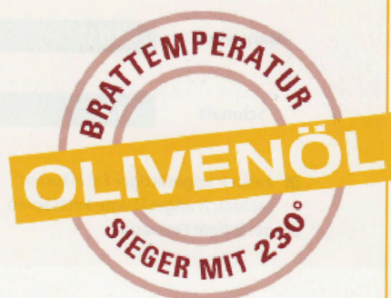
► Abb. 1 Rauchpunkte von Speisefetten und -ölen. Die Angabe zu Olivenöl bezieht sich auf die gleichnamige Güteklasse.

Der Rauchpunkt bei Pflanzenölen hängt im Wesentlichen davon ab, wie hoch der Anteil an mehrfach ungesättigten Fettsäuren ist. Grund: Durch Oxidation von mehrfach ungesättigten Fettsäuren entstehen freie Fettsäuren und diese setzen den Rauchpunkt herab. Somit gilt: Je niedriger dieser Anteil ist, desto besser ist die Verträglichkeit höherer Temperaturen. Hier bieten sich besonders hitzestabile, raffinierte Pflanzenöle an, deren Rauchpunkt über 160 °C liegt, z. B. Oliven-, Raps-, Soja-, Sonnenblumen-, Erdnuss- oder Maiskeimöl. Sieger im „Wettbewerb der hitzestabilsten Öle“ ist das Olivenöl (► Abb. 1).